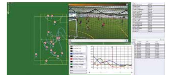
(図4) オブジェクトトラッキングシステム:選手に装着したセンサーから座標位置、移動速度、身体の向き、心拍数などの情報を無線方式でリアルタイムに測定可能な機器