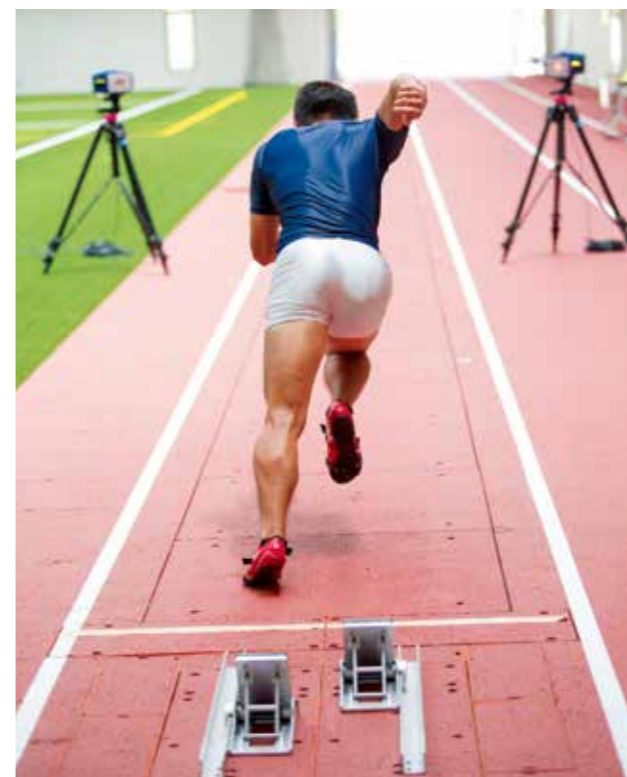
(図1) フォースプレート 走行直線にフォースプレートを54枚設置(スタート地点を含む) 歩行や走行などの動作を行う際の地面反力を測定できる機器