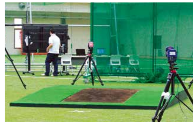
(図2) フォースプレート一体型マウンドおよびバッターボックス フォースプレート完備のピッチャーマウンド・バッターボックスで、投手と打者の同時測定が可能(写真はマウンド)

スポーツパフォーマンス研究センターは、国内初の最先端スポーツ科学研究設備を備えた学内共同教育研究施設です。スポーツ現場のコツやカンといった『実践知』を科学的エビデンスとして創出・還元するスポーツパフォーマンス研究を推進するため2018年に設置されました。屋内スポーツ実験室には主要設備として、世界最長の50mフォースプレート(図1)、フォースプレート一体型マウンドおよびバッターボックス(図2)、モーションキャプチャシステム(図3)、オブジェクトトラッキングシステム(図4)、ハイスピードカメラ、球質測定システム等の最新の測定機器に加え、可動式カメラ架台、大型モニター2台が設置されています。