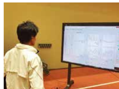
写真3 フィードバック風景