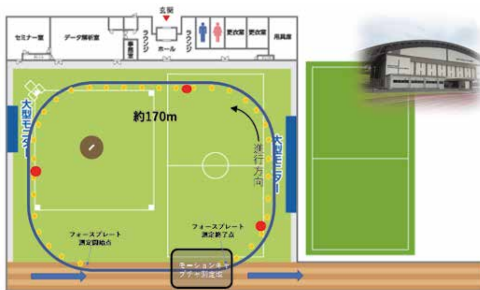
図1 SPセンターでの実施図

ター（以後、SPセンター）にて、中長距離走選手のランニング技術の測定法および評価法に関する研究を行いました。詳しくは、SPセンター内の50mフォースプレー