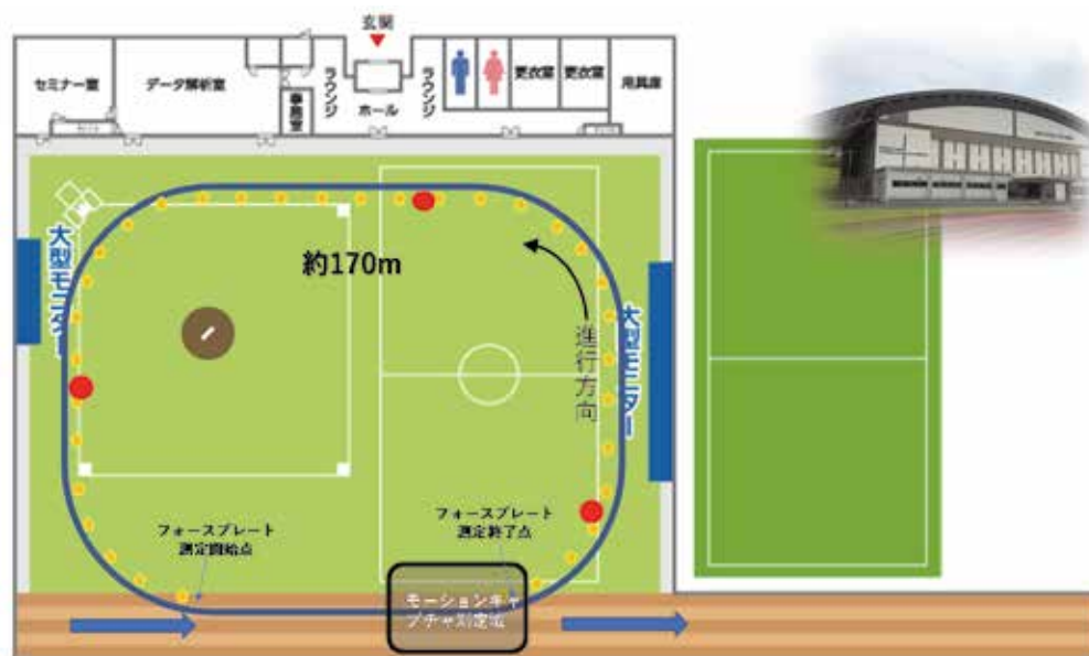
図1 SPセンターでの実施図

ター（以後、SPセンター）にて、中長距離走選手のランニング技術の測定法および評価法に関する研究を行いました。詳しくは、SPセンター内の50mフォースプレー