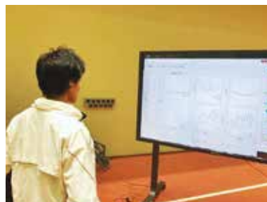
写真2 フィードバック風景