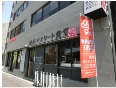
4階建の建物の1階が鹿屋アスリート食堂

6月1日（日）、東京都千代田区・神田錦町にOPENする鹿屋アスリート食堂&RUN CUBEの体験&お披露目会に、東京サテライトキャンパス職員3人で参加してきました！当日は快晴で、走るには暑すぎるくらいの気候でしたが、3人とも皇居周辺の約5kmのランニングを完走しました。その後、RUN CUBEの4階でシャワーを浴びて、汗を流し、1階の鹿屋アスリート食堂で定食を食べました。定食の内容は、主菜3品とご飯、お汁の組み合わせで、バランスの取れた定食をいただきました。