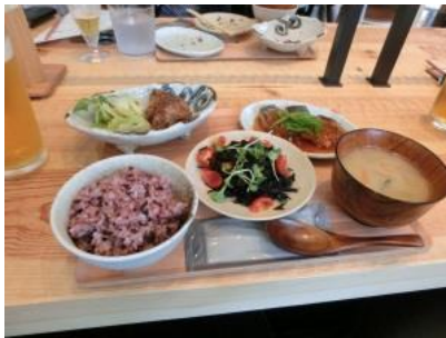
一汁一飯三主菜のバランス定食