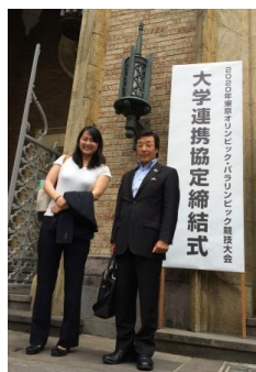
柴田さん（左）、福永学長（右）

6月23日（月）、早稲田大学大隈記念講堂で開催された、標記大会大学連携協定締結式に参加しました。今回の連携協定締結大学は、552校（全国の大学数1,129校）で、当日は267校が参加する中、連携協定締結式、記念シンポジウムが行われました。アテネオリンピック競泳金メダリストで本学卒業生の柴田亜衣さんも福永哲夫学長とともに、大学アスリートとして出席されました。