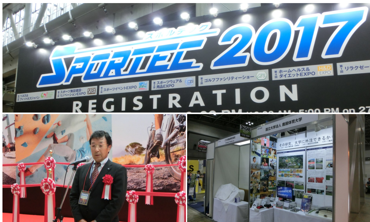
ウェルネスフードジャパンでの様子

7月25-27日、東京ビッグサイトにおいて開催されたウェルネスフードジャパンに本学のブースを出展しました。本学の出展は、昨年に引き続き2回目となります。今回の出展では、「その研究、大学に外注できるかも？」のテーマのもと、スポーツパフォーマンス研究棟の模型、棟内のVR紹介動画や産学連携の成果物の展示を通じて、本学への受託研究や共同研究の広報活動