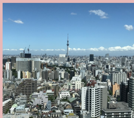
浅草方面の景色(中央は東京スカイツリー)

今回は、東京都文京区春日1丁目にある文京シビックセンター25階・展望ラウンジについて紹介します。文京シビックセンターは、東京都文京区の本庁舎が入居する地上28階・地下4階・高さ142mで、東京23区の区役所の中では最も高い建物です。中でも高速シースルーエレベーター10基があるのが最大の特徴で、庁舎の25階北側に議場を半周囲むように展望室があり、無料で東京の景観を楽しむ事ができます。控えめの照明や、室内照明の反射を避けるために傾斜のついた窓など、展望に最適な環境がきちんと整備されています。文京区内にある東京大学、小石川植物園をはじめ、東京スカイツリーや新宿副都心の高層ビル群、富士山や筑波山まで見渡せます。開館時間は9時から20時30分まで、土曜日・日曜日も開館しています。文京区にお越しの際は是非足を運ばれてみてはいかがでしょうか。