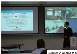
学位論文中間発表会