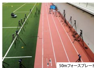
50mフォースプレート