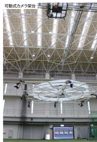
可動式カメラ架台