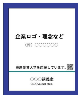
壁面設置パネルのイメージ(例) (サイズA1～A4判程度)

広告費用は掲示物のサイズにより決定します。参考に以下のとおり目安をお示しします。