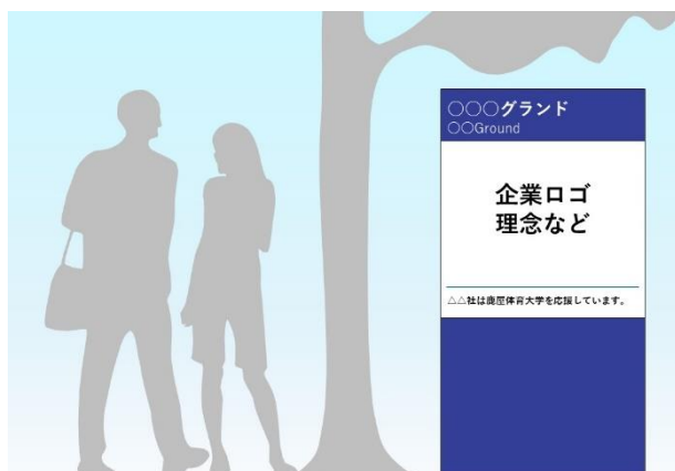
屋外体育施設等の設置例

広告等の表示デザイン、取付け位置等は申し込み時に応募者から提案を受け、本学ネーミングライツ・パートナー選定委員会での審議により決定しますが、例として以下のようなものを想定しています。