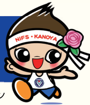
鹿屋体育大学公式マスコットキャラクター パララン

ご寄附は教育研究の活性化、国際交流、社会貢献につながる事業のために役立てられます。