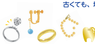
貴金属・ジュエリー