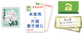
切手・ハガキ・金券類