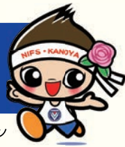
鹿屋体育大学公式マスコットキャラクター バララン

ご寄附は教育研究の活性化、国際交流、社会貢献につながる事業のために役立てられます。