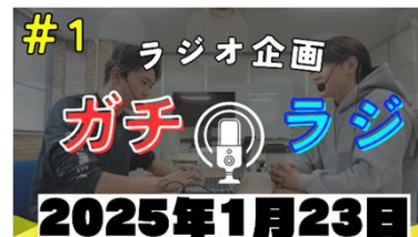
#1 (ラジオ企画 ガチラジ) R7. 2投稿 ※新規企画