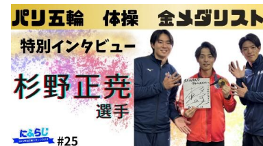
#25 (杉野選手 特別インタビュー) R7. 1投稿